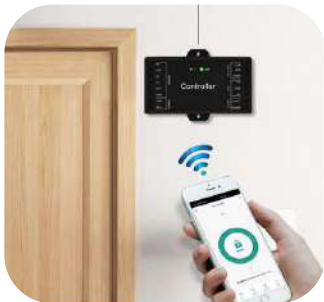
Conexión WIFI, acceso remoto soporta 3G/4G/5G

Sboard-III WIFI es un mini controlador WIFI integrado con el módulo WIFI Tuya. Puede trabajar con cualquier lector wiegand 26~44, 26, 58 bits.