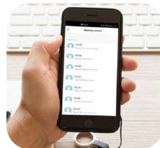
Historial de aperturas