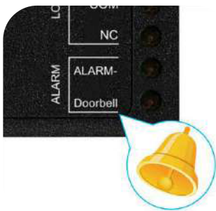
Timbre de aviso de llamada