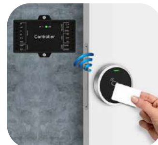
Puede trabajar con cualquier lector wiegand 26~44, 26, 58 bits